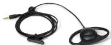
Headset 4 polig type US